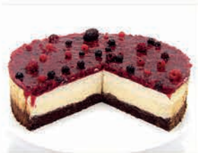
Wunderkuchen Div. Sorten z.B. Waldbeere