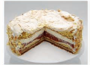
Wölkchen - Erdbeer - Rhababer