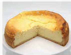
Käsekuchen Div. Sorten