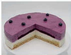
Blaubeer - Buttermilch - Torte