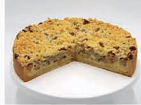
Streusselkuchen z.B. Apfel oder Rhabarber