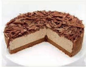
Schoko - Knusper - Torte