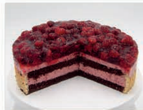
Himbeer - Joghurt - Torte