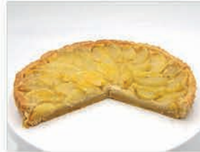
Marzipan - Apfel - Tarte