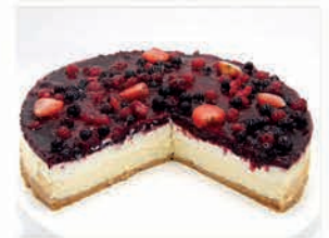
Cheesecake Div. Sorten