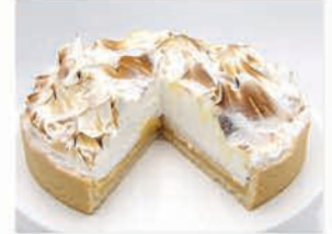
Zitrone - Baiser - Tarte