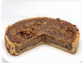
Walnuss - Tarte