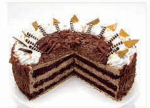
Schoko - Mousse - Torte