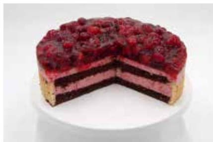
Himbeer - Joghurt - Torte