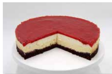
Wunderkuchen Div. Sorten z.B. Erdbeere oder Blaubeere