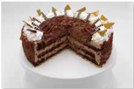
Schoko - Mousse - Torte