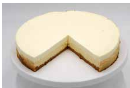
Cheesecake Div. Sorten