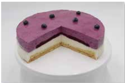
Blaubeer - Buttermilch - Torte