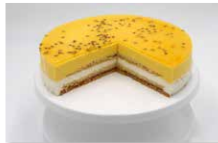
Mango - Maracuja - Torte