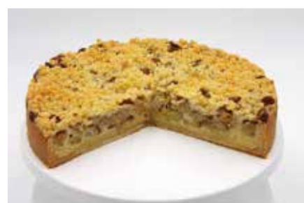
Streusselkuchen Div. Sorten z.B. Apfel oder Rhababer