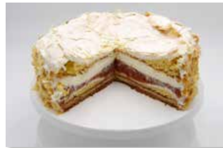
Wölkchen - Erdbeer - Rhababer