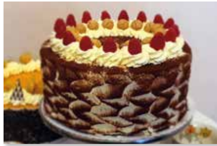
Tiramisu - Himbeer Torte XXL