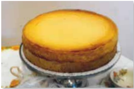
Käsekuchen Div. Sorten