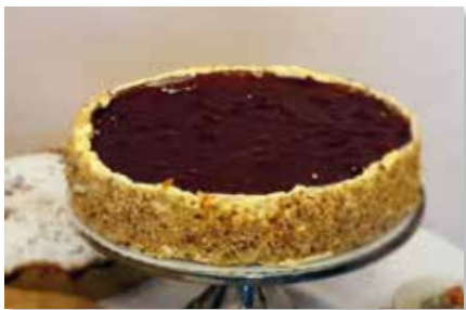
Marzipan - Himbeer - Tarte