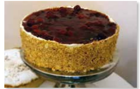
Joghurt - Torte Himbeer oder Manderine