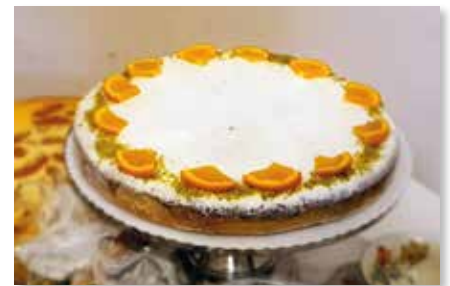
Franz. Orangen - Mandel - Tarte