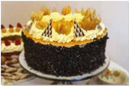
Schokomousse - Maracuja Torte XXL